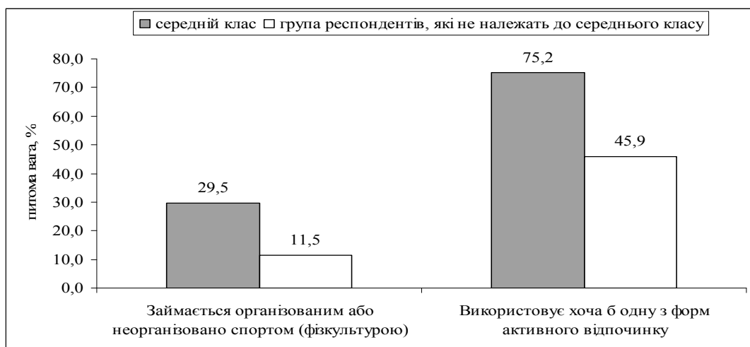
Рис. 2. Використання активного відпочинку представниками середніх класів та індивідами, які не входять у середніх класів 27

Загалом серед представників середніх класів 75,2% використовують ті чи інші форми активного відпочинку, зокрема майже 30% займаються фізкультурою та спортом (рис. 2.).