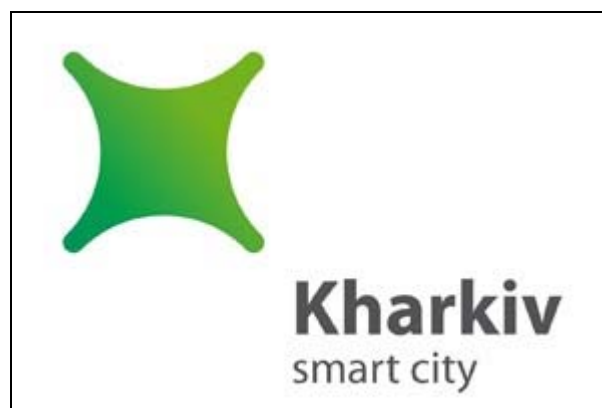
Рис. 1. Туристический бренд Харькова