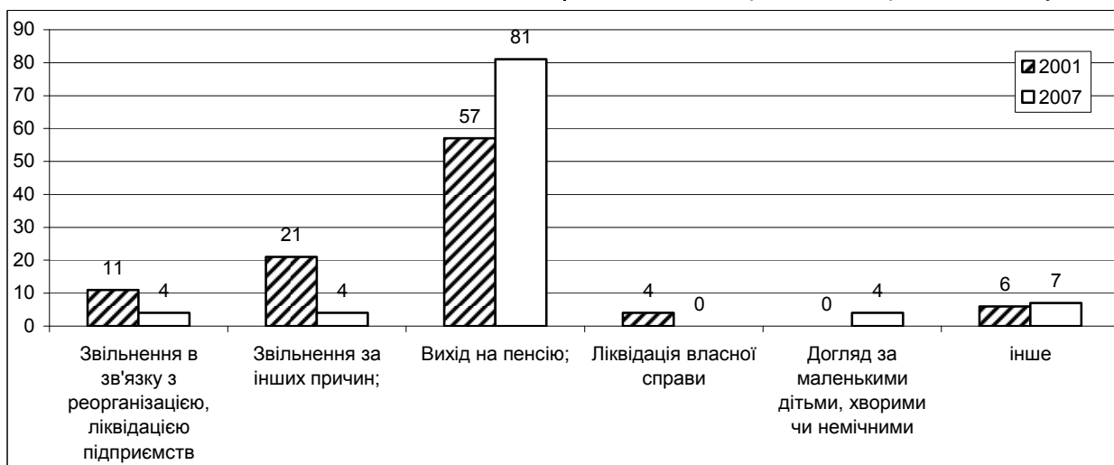
Рис. 2. Причини незайнятості ліквідаторів, 2001 і 2007 роки, %

Для забезпечення адекватної соціальної політики щодо покращення соціально-економічного стану ліквідаторів аварії на ЧАЕС потрібно спрямувати зусилля державних органів влади на вирішення питань щодо належного фінансування всіх Чорнобильських програм, спрямованих на забезпечення соціального захисту постраждалих. Враховуючи реальні можливості державного бюджету, потрібно першочергову увагу зосередити на медичній допомозі ліквідаторам, адже основні соціальні проблеми ліквідаторів прямо або опосередковано пов'язані з погіршенням їх фізичного стану.